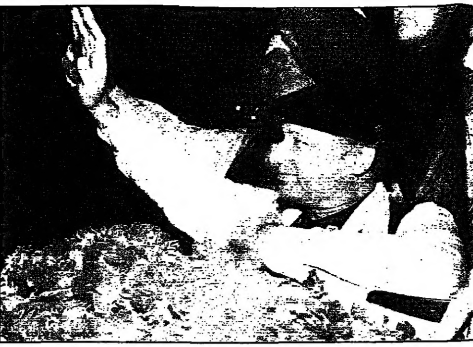
نواز شريف زعيم حزب الرابطة الإسلامية الباكستاني يحيي مؤيديه عقب انتصار حزبه الانتخابي في مدينة لاهور (رويترز)

■ أثينا - يتوقع مسؤولون في الخارجية اليونانية حدوث نشوب حرب مع أنقرة في حال فشل جهود تسوية الأزمة القبرصية. وقال مسؤولون في الخارجية اليونانية في بيان صحفي صادر عن الخارجية في أثينا، إن اليونان تتوقع نشوب حرب مع أنقرة في حال فشل جهود تسوية الأزمة القبرصية. وقال المسؤولون إن اليونان تتوقع نشوب حرب مع أنقرة في حال فشل جهود تسوية الأزمة القبرصية. وقال المسؤولون إن اليونان تتوقع نشوب حرب مع أنقرة في حال فشل جهود تسوية الأزمة القبرصية.